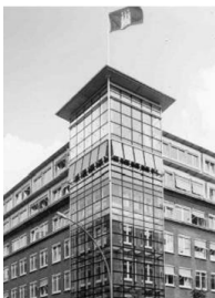
Büro Hamburg ABC-Straße 35 20354 Hamburg