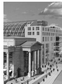
Büro Stuttgart Bolzstraße 3 70173 Stuttgart