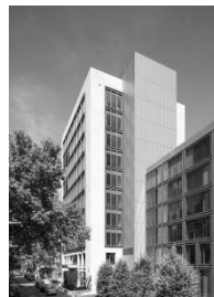
Büro Frankfurt Guiollettstraße 48 60325 Frankfurt am Main